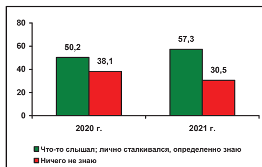
Рис. 2. Знаете ли Вы о деятельности в Вологодской области некоммерческих (общественных) организаций? (в % от числа опрошенных)

Среди наиболее ярких изменений, произошедших за период с 2020 по 2021 г., следует выделить ощутимый рост информированности населения о деятельности региональных некоммерческих организаций (НКО), что, по-видимому, связано с активизацией волонтерского движения в период эпидемии COVID-19. За последний год доля жителей, так или иначе осведомленных о работе некоммерческого сектора, увеличилась с 50 до 57% (на 7 п.п.), а удельный вес тех, кто ничего не знает о деятельности НКО, снизился с 38 до 31% (также на 7 п.п.; рис. 2).