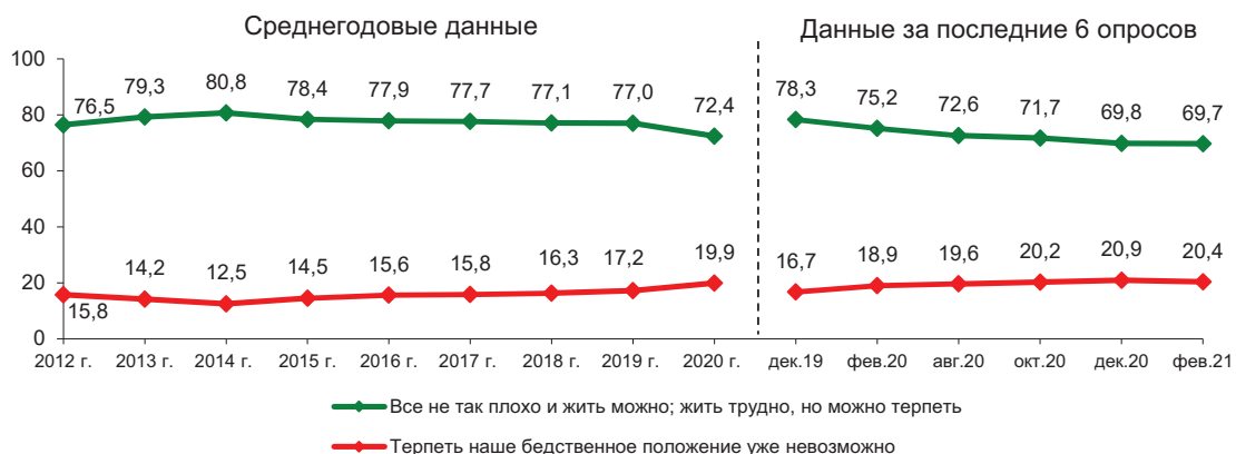
Рис. 25. Динамика показателя запаса терпения (в % от числа опрошенных)*