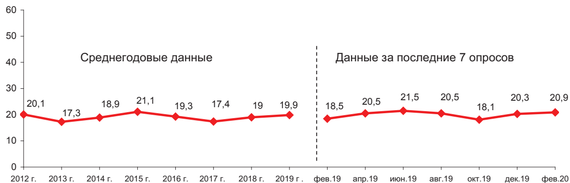
Рис. 24. Динамика потенциала протеста (в % от числа опрошенных)*

В декабре 2019 – феврале 2020 г. протестный потенциал жителей области существенно не изменился (20–21%; рис. 24 ).