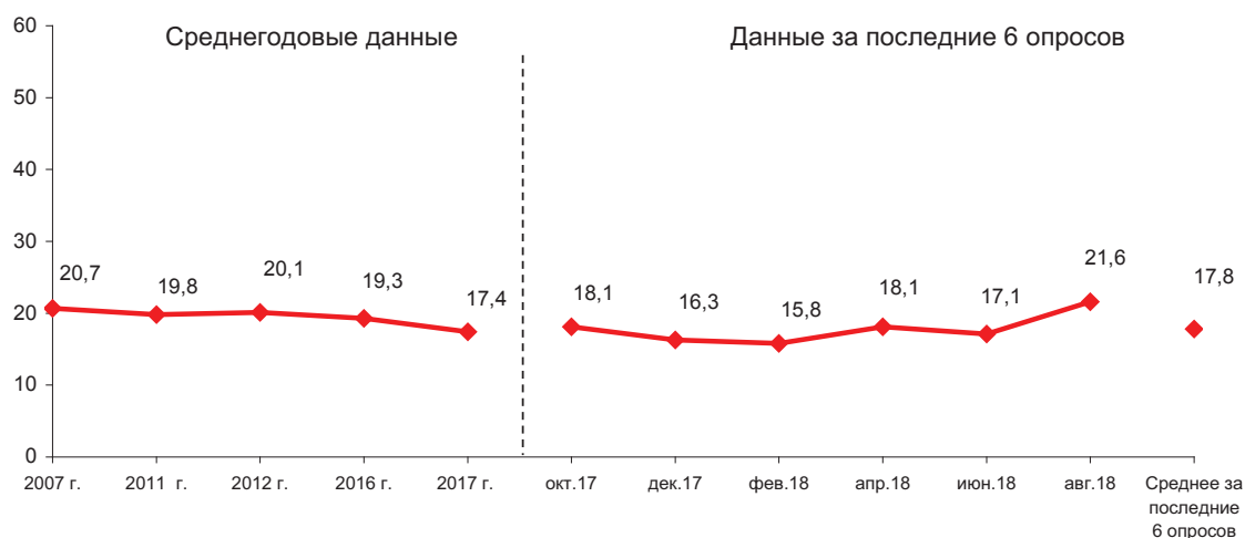
Рис. 52. Динамика потенциала протеста (в % от числа опрошенных)*

* Потенциал протеста составляют респонденты, ответившие на вопрос «Что Вы готовы предпринять в защиту своих интересов?» следующим образом: «Выйду на митинг, демонстрацию»; «Буду участвовать в забастовках, акциях протеста»; «Если надо, возьму оружие, выйду на баррикады».