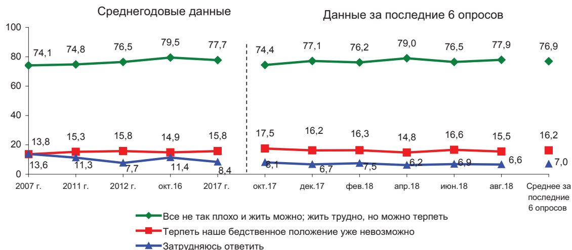
Рис. 50. Динамика показателя запаса терпения (в % от числа опрошенных)*

В августе оценки запаса терпения соответствуют уровню июня 2018 г.: доля позитивных отзывов достигает 77–78%, негативных – 16–17% (рис. 50).