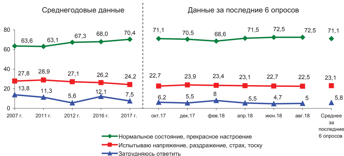
Рис. 48. Динамика показателя социального настроения (в % от числа опрошенных)* * Распределение ответов на вопрос «Что бы Вы могли сказать о своем настроении в последние дни?»

За два последних месяца характеристики социального настроения существенно не изменились: доля положительных суждений достигает 73 п.п., отрицательных – 23 п.п. (рис. 48).