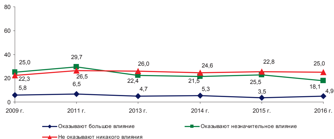
Рис. 43. На Ваш взгляд, в какой степени некоммерческие (общественные) организации влияют на жизнь области? (в % от числа опрошенных)*